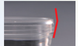
35mm・60mmディッシュ側面