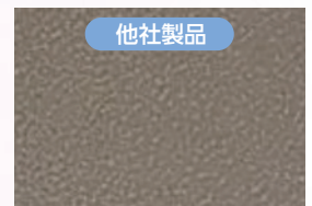
培養面の顕微鏡写真 ×100