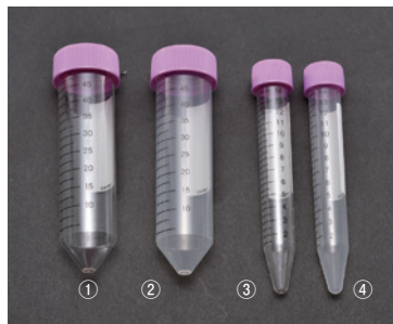
①③ポリスチレン製(PS製) ②④ポリプロピレン製(PP製)