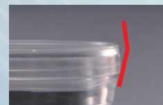
35mm・60mmディッシュ側面