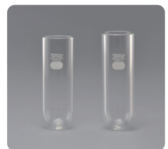
左: 8540CTF 右: 8550CTF

本キャンペーン対象の遠心沈澱管は一部品種のみとなっております。その他の品揃えについては、 IWAKI カタログ最新版にてご確認ください。なお、その他の品種はキャンペーン対象外となります。